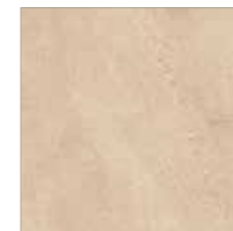
75 500 sahara