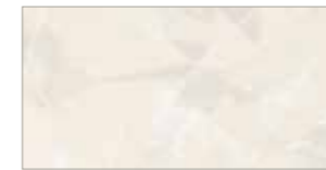
30 172 sand sable