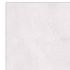
75 480 kreide chalk craie

Bodenfliese, Feinsteinzeug, durchgefärbt, rektifiziert, R10B Floor tile, porcelain stoneware, solid-coloured, rectified, R10B Carreau de sol, grès cérame, coloré, rectifié, R10B