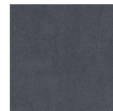
75 560 grafit graphite

Art.-Nr. 07.291.001 Die Brillanz von Glasuren und Fliesenfarben kann im Druck nur annähernd wiedergegeben werden. Ihr Fliesenfachhändler wird Ihnen gerne das Original zeigen. The brilliance of the glazing and the colours of the tiles can be only reproduced in print to an approximate extent. Your tile specialist dealer will be pleased to show you the originals. La brillance des vernis et des couleurs des carreaux ne peut être reproduite sur papier que de façon approximative. Votre spécialiste carrelage se fera un plaisir de vous montrer l'original.