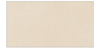
30 171 sand sable