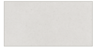
30 176 zement cement ciment