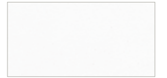
30 175 grau grey gris