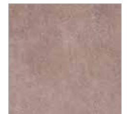
75 520 taupe